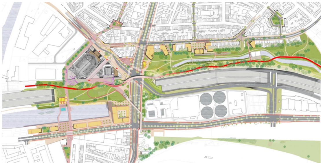
Eindbeeld scrumsessie Ringpark het Schijn met suggestie van nieuwe toegangen tot het Ringpark

Het project illustreert de relatie tussen het geheel van de 'Ringzone' en de strategie voor de realisatie enerzijds en het grondbeleid dat de kern vormt van het strategisch project anderzijds. De realisatie van het Ringpark Schijn is in zijn globaliteit strategisch van aard. De aanpak om te starten met de (hoofd)toegangen is realistisch. Het zal een hefboom vormen voor het strategisch project en voor de aanpalende stadswijk. Deze subsidie zal de kernactoren (stad/autonoom gemeentebedrijf, andere) in staat stellen te beschikken over de strategisch gelegen gronden en constructies, waarmee een opening door het woonblok kan worden gemaakt en een eerste hoofdtoegang naar Ringpark 't Schijn gerealiseerd.