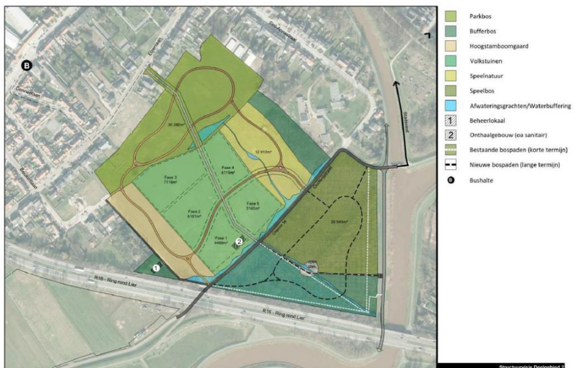
Figuur 17: Visienota landschapspark Pallieterland

Voor het grondbeleid in dit gebied worden middelen van diverse partners samengelegd, met stad Lier, OCMW, Polder van Lier en het Agentschap voor Natuur en Bos als belangrijkste. Voor de te bebossen percelen wordt gebruik gemaakt van de subsidieoproep van Agentschap voor Natuur en Bos en de middelen uit het boscompensatiefonds. De stad Lier heeft het engagement opgenomen om alle andere gronden die het openruimtegebied zullen vormen, stapsgewijs aan te kopen en in te richten als landschapspark. Voorliggende subsidie ondersteunt bijgevolg de gehele aankoopstrategie, om via deze financiële bijdrage méér gronden te kunnen verwerven en een groter deel van het landschapspark Pallieterland op korte termijn effectief te kunnen realiseren.