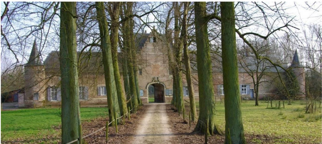
Zicht op het poortgebouw van de te verwerven Kasteelhoeve

Binnen het project is er werk gemaakt van een sterk grondbeleid, dat effectief ingezet kan worden om de doelstellingen van het project waar te maken. Voor het gebied 'Graafweide-Schupleer' is de herinrichting in volle uitwerking. Hiervoor is een sterke samenwerking opgezet tussen de betrokken partners, waarbij instrumenten en middelen worden samengelegd. Een inrichtingsvisie vormt de basis voor gerichte investeringen. Een proactief grondbeleid, een lokale grondenbank, een beheersovereenkomst met Natuurpunt en middelen van private partners, worden in het project slim gekoppeld aan investeringen en subsidies van de lokale partners, zoals de gemeente Grobbendonk en vzw Kempens Landschap. Ook de Vlaamse partners dragen hun steentje bij, zoals het Agentschap voor Natuur en Bos en De Vlaamse Waterweg. Op die manier is er zekerheid over de effectieve realisatie van de visie en doelstellingen in de vallei van de Kleine Nete.